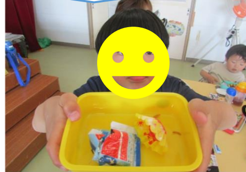
焼きそばゴマご飯完食できた！