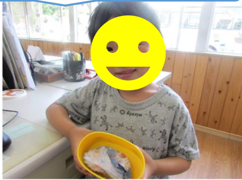
お弁当 3 日目、完食できたよ！