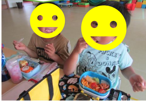
春巻きも美味しそうだな...