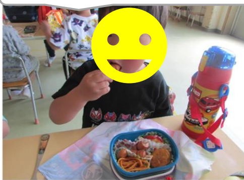
お祭りみたいなお弁当！完食できたよ