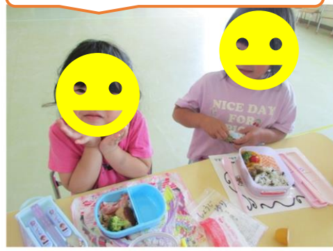
お弁当、全部が美味しかった