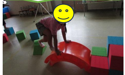
つるつる滑って面白いね！