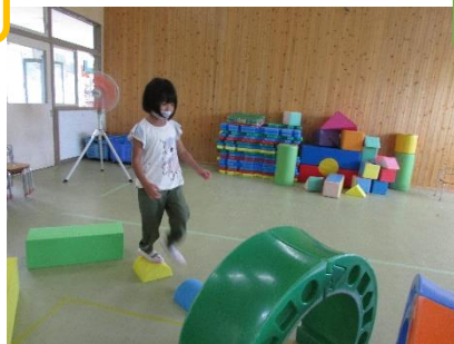
大きいトランポリン楽しいな！