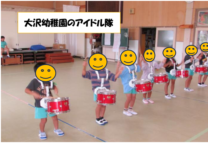
大沢幼稚園のアイドル隊