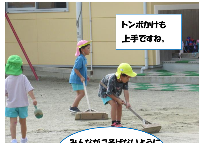
どうして砂を買ってもらったか聞いてみました。