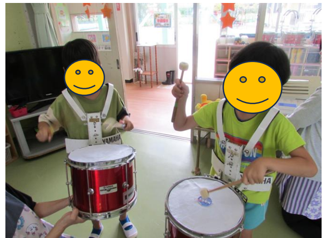
憧れのトリオ 頑張ります。