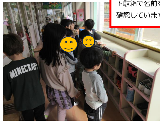
下駄箱で名前を確認しています。