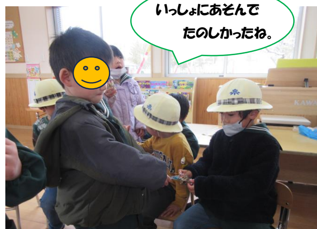
いっしょにあそんで たのしかったね。