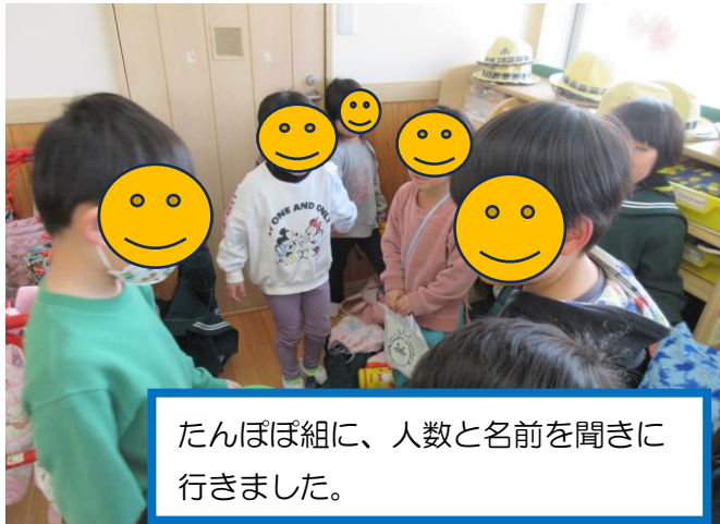
たんぽぽ組に、人数と名前を聞きに行きました。